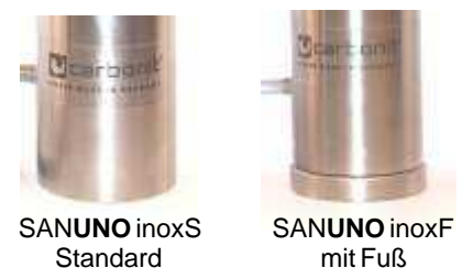
SANUNO inoxS Standard