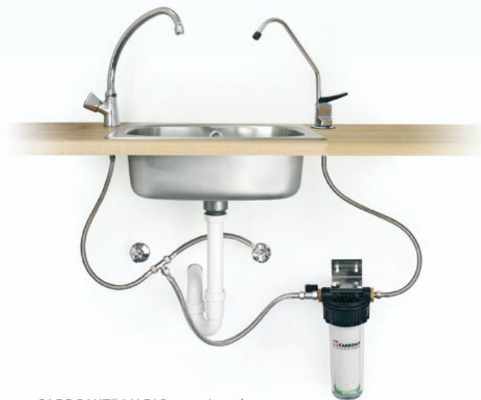
CARBONIT® VARIO para instalar debajo del fregadero con o sin grifo aparte: el confort que siempre ha deseado.