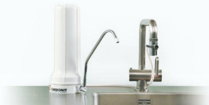
CARBONIT® SANUNO para instalar sobre el fregadero: económico, flexible, fácil de instalar

Sencillos. Seguros. Prácticos. Buenos. Filtros Carbonit® en su cocina.